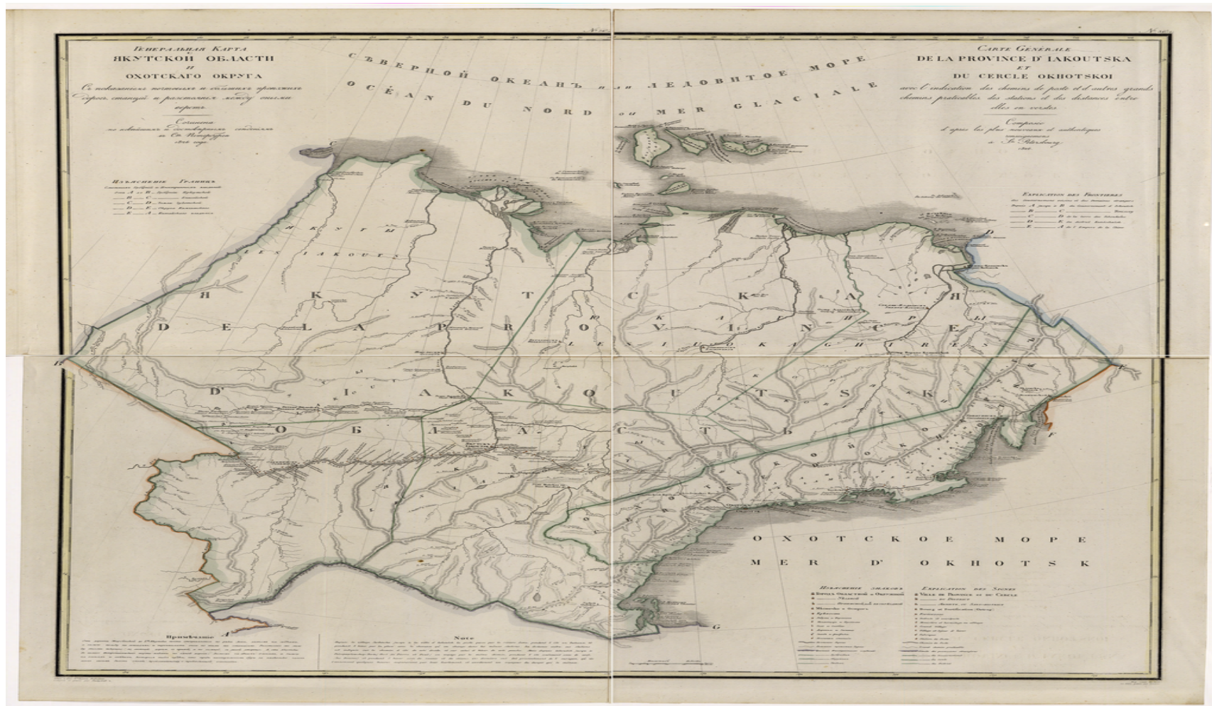
Изображение 2. Генеральная карта Якутской области и Охотского округа с показанием почтовых и больших проезжих дорог и станций. 1826 г.

https://www.wdl.org/ru/item/14107/view/1/1/