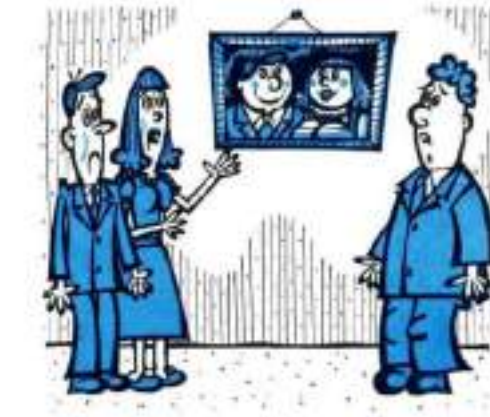
— А здесь мы с Лелей до пенсионного дня. Р. СЕРГЕЕВ. А. КОВАЛЕНКО. Московская обл. (тем.).