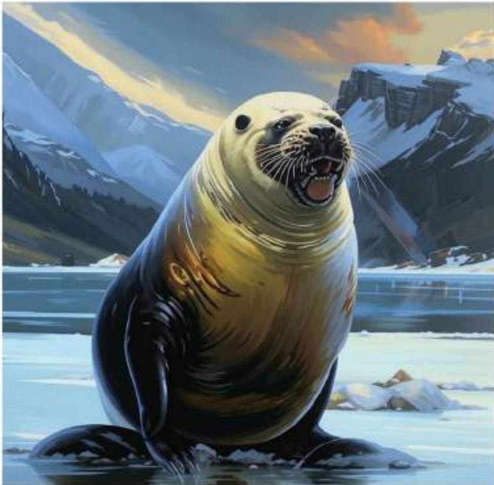
Изображение сгенерировано нейросетью Kandinsky

«Не всё то золото, что поёт, но Zoloto поёт». Репортаж с концерта – с. 2.