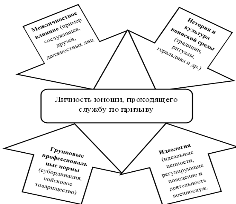
Рис. 1. Основные факторы воспитания юношей в условиях их службы по призыву

При анализе основных воспитательных факторов, оказывающих формирующее воздействие на личность воина, отмечено, что воспитательная система современной армейской образовательной среды не предусматривает диалоговое общение и актуализацию процессов смысловой рефлексии, являющихся условием развития личностных смыслов. Их включение в структуру психолого-педагогического процесса армейской службы по призыву являлось задачей нашего исследования.